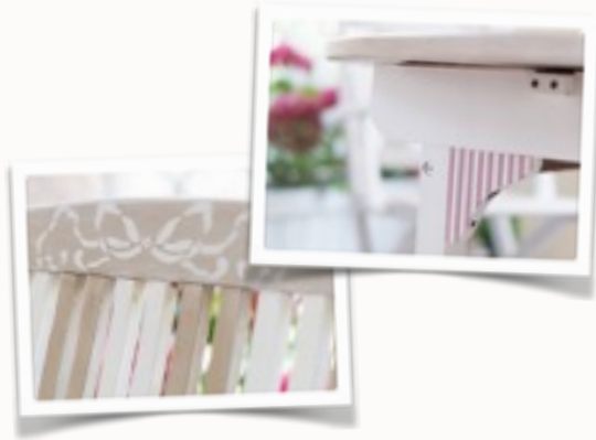
Particolari di un classico set da giardino in teak trasformato con le tecniche dello shabby

Lo Stile Shabby Chic si afferma oggi grazie alla genialità e al gusto raffinato di Rachel Ashwell , designer ed imprenditrice statunitense di origini inglesi, che ha saputo riproporre, in una luce nuova e contemporanea, uno stile che trova nel Gustaviano uno dei suoi precursori.